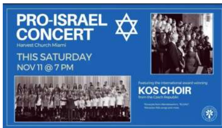
KOSdeník z amerického turné viz příloha č. 6