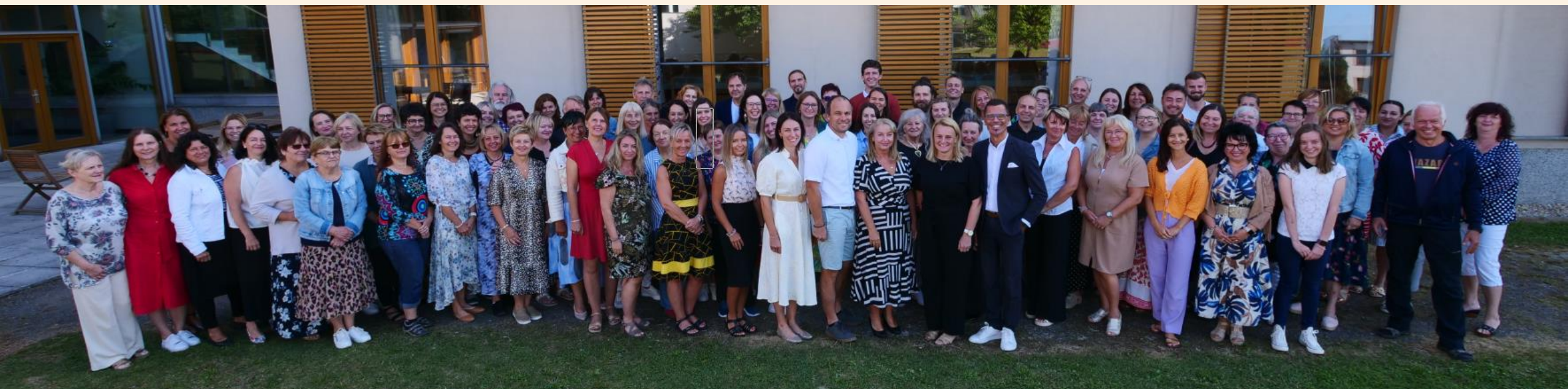
Zaměstnanci Pedagogické školy v Litomyšli